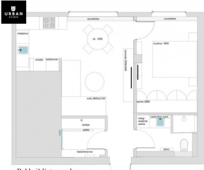
Baldų išdėstymo planas