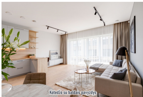
Kotedžo su baldais pavyzdys