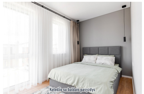
Kotedžo su baldais pavyzdys