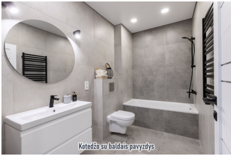
Kotedžo su baldais pavyzdys