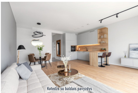
Kotedžo su baldais pavyzdys