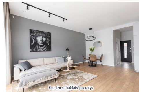
Kotedžo su baldais pavyzdys