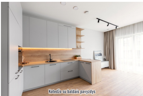
Kotedžo su baldais pavyzdys