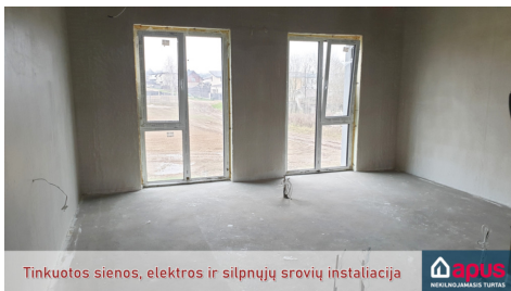
Tinkuotos sienos, elektros ir silpnųjų srovių instaliacija