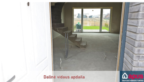
Dalinė vidaus apdaila