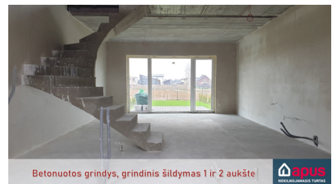
Betonuotos grindys, grindinis šildymas 1 ir 2 aukšte!