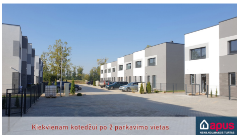
Kiekvienam kotedžui po 2 parkavimo vietas