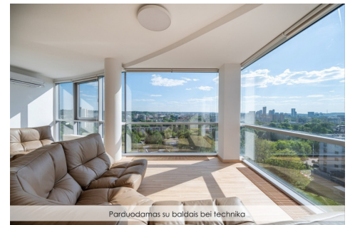
Parduodamas su baldais bei technika