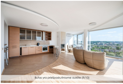
Butas yra priešpaskuliniame aukšte (9/10)