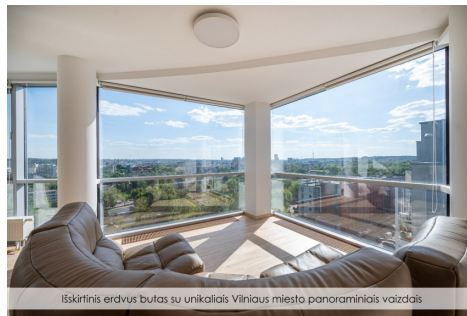
Išskirtinis erdvus butas su unikaliais Vilniaus miesto panoraminiais vaizdais