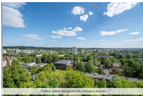
Visiškai greta daugiaabučio žaliosios erdvės