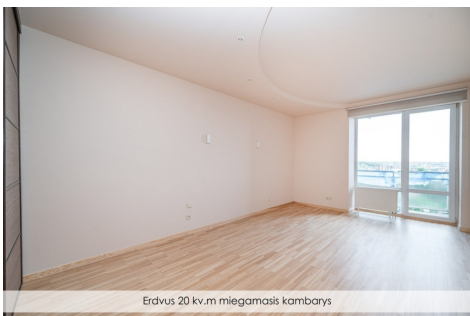
Erdvus 20 kv.m miegamasis kambarys