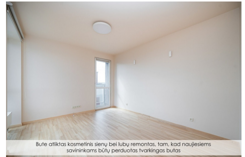
Butė atliktas kosmetinis sienų bei lubų remontas. Tam, kad naujesiems savininkams būtų perduotas tvarkingas butas