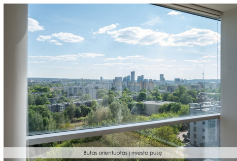
Butas orientuotas į miesto pusę