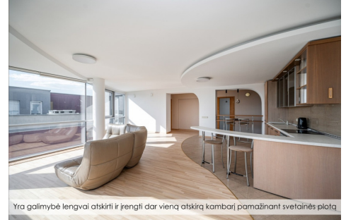
Yra galimybė lengvai atskirti ir įrengti dar vieną atskirą kambarį pamažinant svetainės plotą