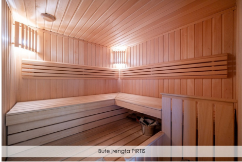
Bute ierengta PIRTIS