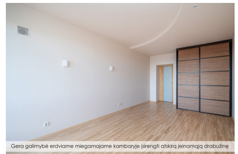
Gera galimybė erdviame miegamajame kambaryje įrengti atskirą įeinamąją drabužinę