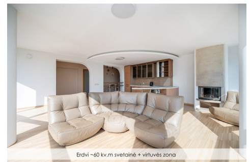
Erdvi ~60 kv.m svetainė + virtuvės zona