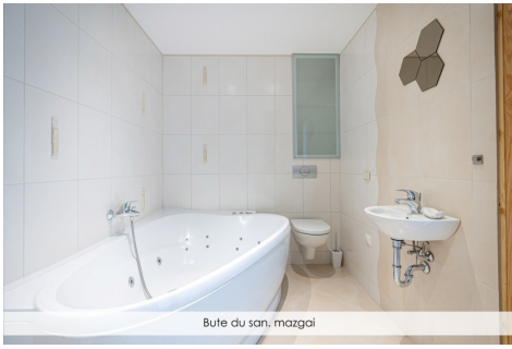
Bute du san, mazgai