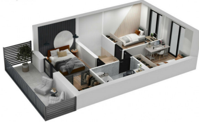
2 aukšto planas