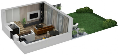
1 aukšto planas