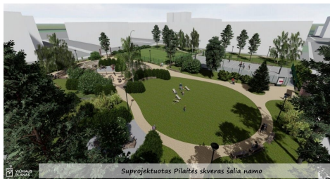
Suprojektuotas Pilaitės skveras šalia namo