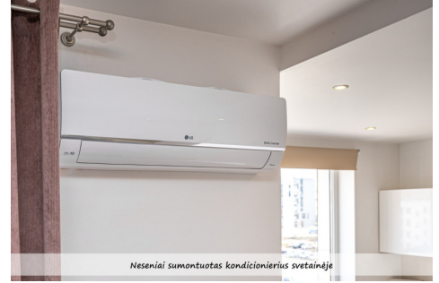
Neseniai sumontuotas kondicionierius svetainėje