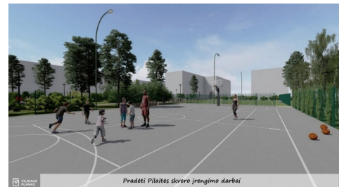
Pradėti Pilaitės skvero įrengimo darbai