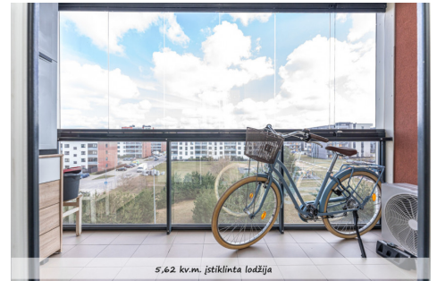
5,62 kv.m. įstiklinta lodžija