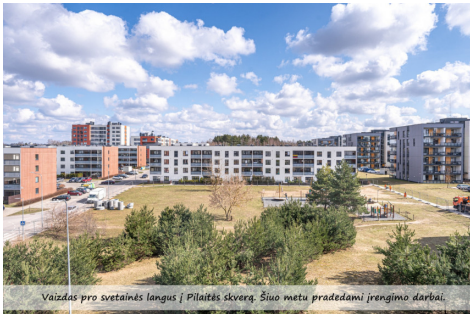
Vaizdas pro svetainės langus į Pilaitės skverg. Šiuo metu pradedami įrengimo darbai.