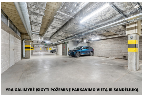
YRA GALIMYBĖ ĮSIGYTI POŽEMINĘ PARKAVIMO VIETĄ IR SANDĖLIUKĄ