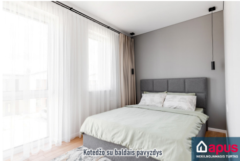
Kotedžo su baldais pavyzdys