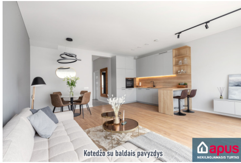
Kotedžo su baldais pavyzdys