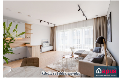
Kotedžo su baldais pavyzdys